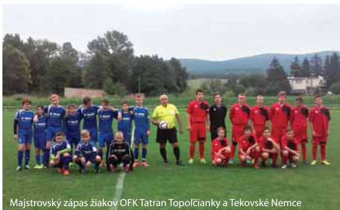
Majstrovský zápas žiakov OFK Tatran Topoľčianky a Tekovské Nemce