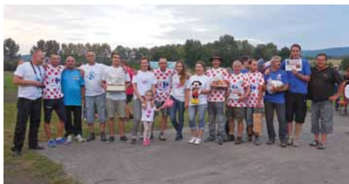
Výherné družstvá 1. ročníka Súťaže vo varení gulášu