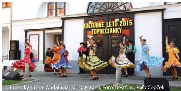
Umelecký súbor Andalucia, KL 30.8.2015