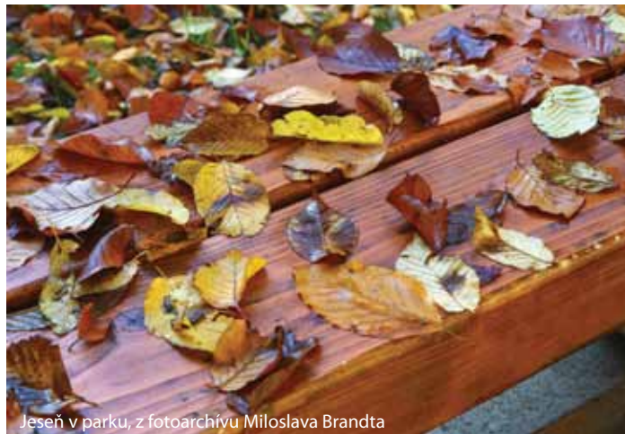
Jeseň v parku

J. Klučiarová - o prenájom nebytových priestorov v priestoroch Domu služieb na prevádzku - výroba zdobených perníkov – poslanci schválili zámer prenajať majetok z dôvodov osobitného zreteľa za účelom výroby trvanlivého pečiva