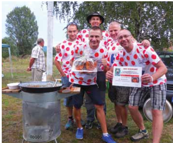
Z 3. miesta sa tešilo aj družstvo CK Machulince