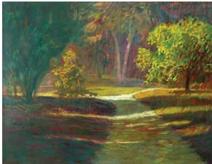
Peter Daniš / Katalpa, olej na plátne, 70x90cm, 2015