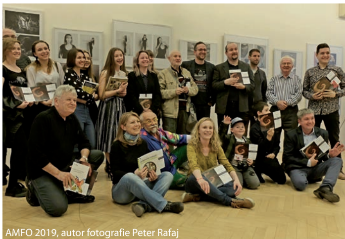
AMFO 2019