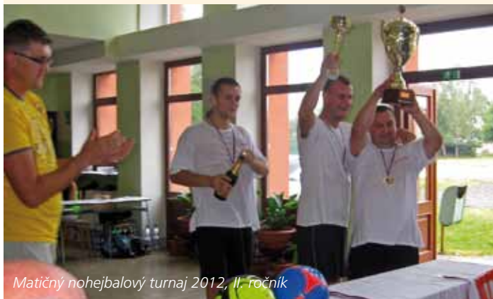
Matičný nohejbalový turnaj 2012, II. ročník