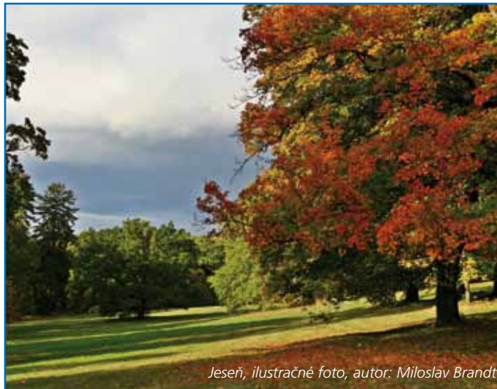
Jeseň, ilustračné foto

V mesiaci november sa uskutoční technická kolaudácia zrealizovaného projektu „Revitalizácia centrálnej časti obce Topolčianky – II. etapa“. „Slávnostnú kolaudáciu zrealizovaného diela“ plánujeme uskutočniť za prítomnosti pozvaných významných rodákov a hostí v jarných mesiacoch budúceho roka – o konkrétnom termíne Vás budem včas informovať.