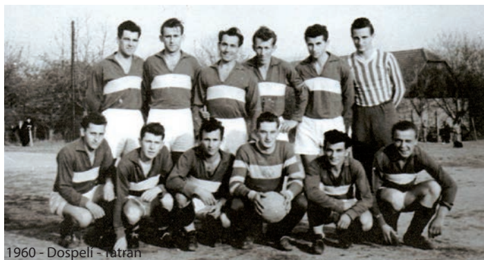
1960 - Dospeli - Tatran

Z dostupných zdrojov spracoval: Ing. Pavol Mihók Mgr. Ladislav Šusták