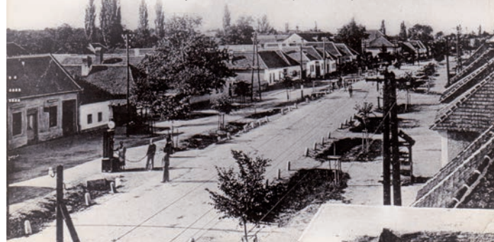
Historická fotografia Hlavnej ulice z obdobia približne pred 100 rokmi

čas. Hoci len malým kamienkom, ale každý z nás skladáme mozaiku Topolčianok. Budme aj