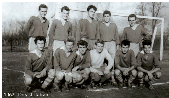
1962 - Dorast - Tatran

Športovú činnosť v obci narušili politické udalosti v druhej polovici roku 1938, kedy zanikla činnosť futbalového klubu. Obnovila sa na jar v roku 1940 a znovu bola prerušená od au-