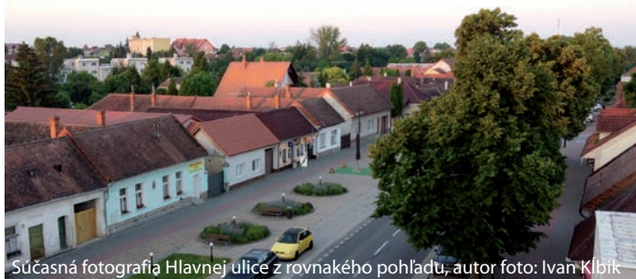
Súčasná fotografia Hlavnej ulice z rovnakého pohľadu

Medzi Obcou Topolčianky a Lesmi Slovenskej republiky, š. p., odštepným závodom Topolčianky je vybudovaná dlhoročná spolupráca, ktorá vedie k spokojnosti oboch zúčastnených strán. Aj v budúcnosti by sme radi túto spoluprácu rozvíjali, a tým prispeli nielen k spokojnosti oboch spomínaných partnerov, ale i k spokojnosti občanov a návštevníkov našej obce a tiež návštevníkov Lesov SR, š. p., odštepny závod Topolčianky.