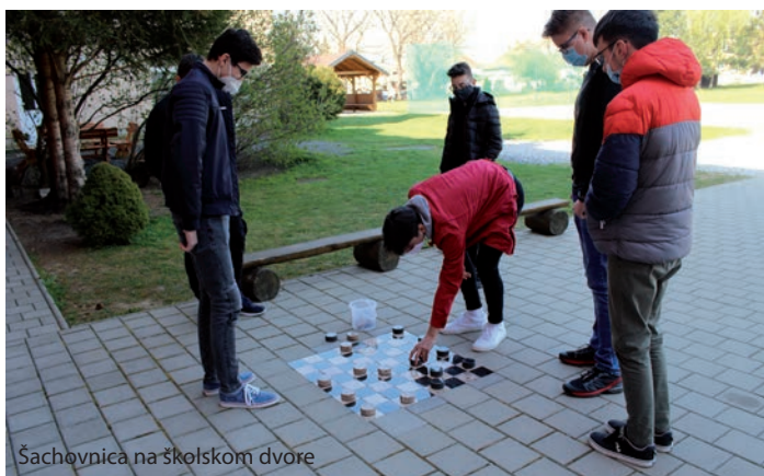
Šachovnica na školskom dvore