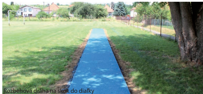
Rozbehová dráha na skok do diaľky

Popri zabezpečení podmienok pre dištančné vzdelávanie, ktoré dominovalo nad prezenčným hlavne u žiakov druhého stupňa, sa život žiakov nespomalil, dokonca bol hektickejší. Nepeagogickí zamestnanci neustále zabezpečovali ranný filter, dezinfekciu priestorov a opatrenia pre zabezpečenie bezproblémovej