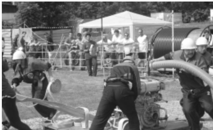
Súťažné družstvo DHZ Topoľčianky pri plnení disciplíny „vodný útok“