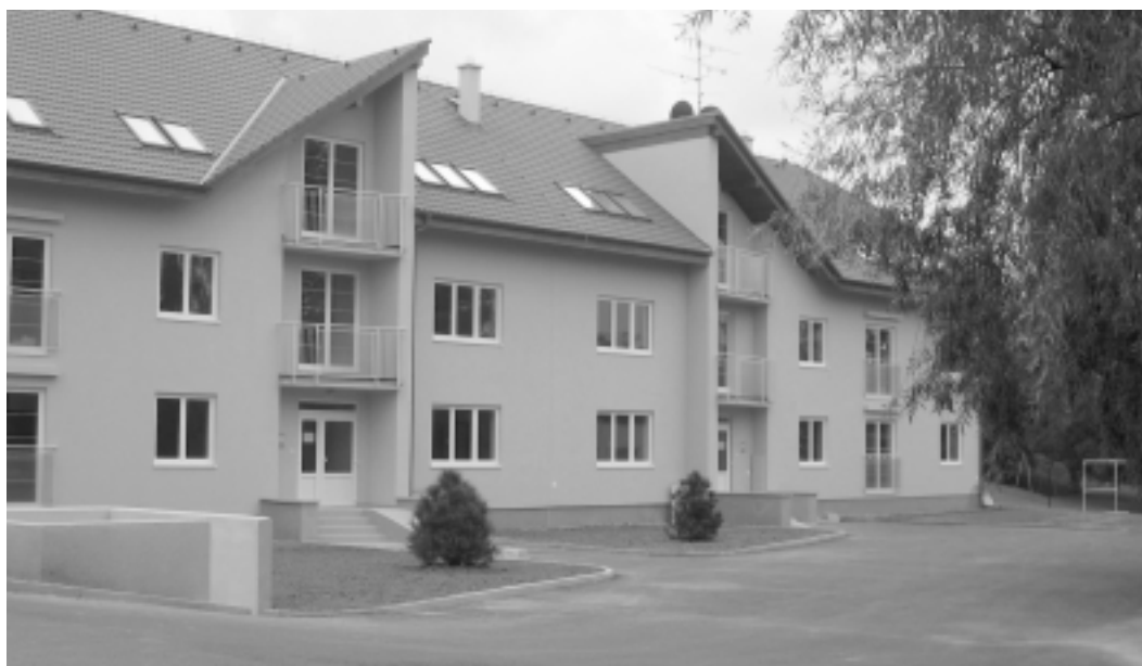
Pohľad na bytovku, ktorá krátko po kolaudácii prijíma svojich prvých obyvateľov.