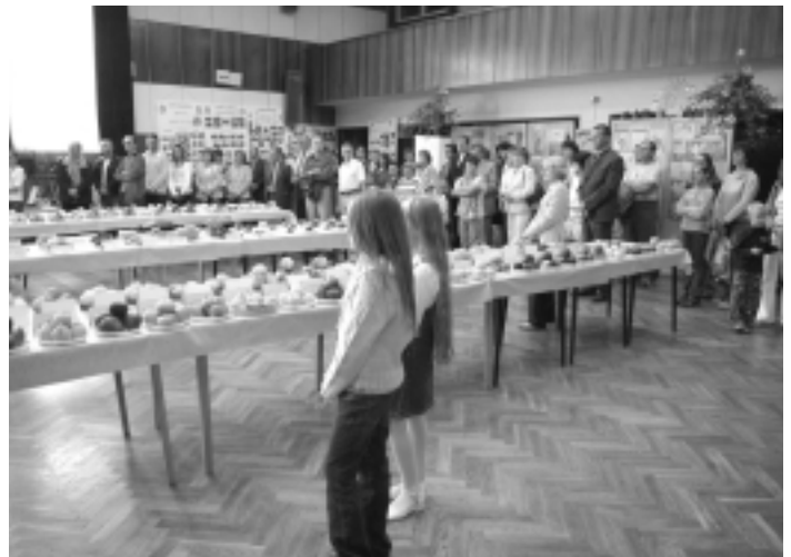
Pohľad na vystavené exponáty a návštevníkov výstavy počas vyhodnotenia