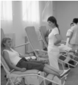
Darcovia krvi v DKS Topoľčianky V. Kováčová

Leto a prázdniny sú pre nás mnohých už len peknými spomienkami na oddych, dovolenky, či nové zážitky. Najväčším šťastím však je, ak sme sa vrátili domov zdraví a nepotrebovali sme pomoc záchranárov. Práve oni spolu s lekármi zápasia cez obdobie dovoleniek s veľkým problémom - nedostatkom krvi. Mnohé transfúzne stanice vyzývajú počas prázdnin ľudí, aby prišli podať pomocnú ruku tým, ktorí to vtedy najviac potrebujú. Miestny spolok Slovenského Červeného kríža preto zorganizoval 23. augusta 2007 hromadný odber