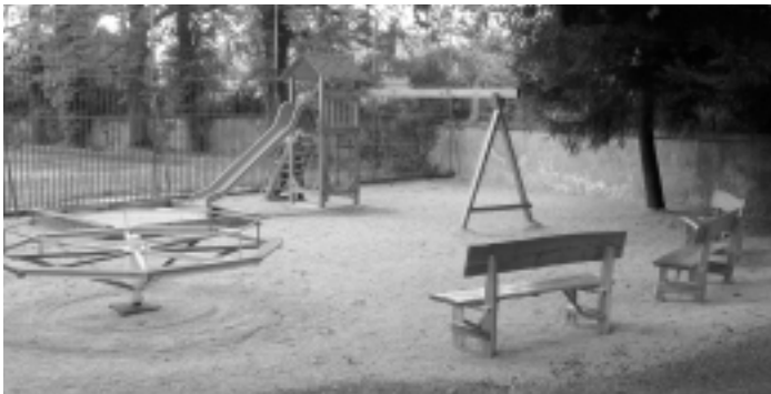
Detské ihrisko - zdravý pohyb pre deti