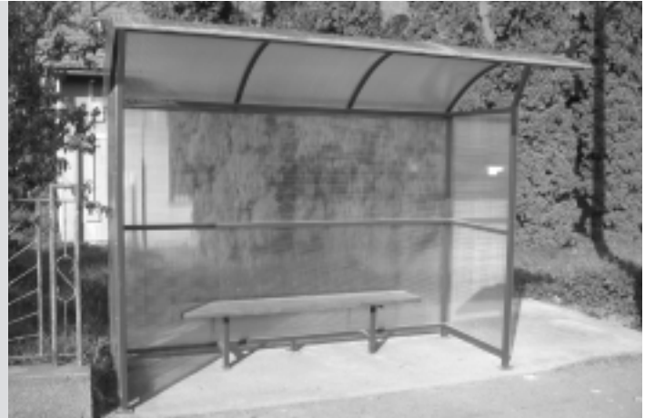
Autobusová zastávka na Hlavnej ulici - Moravecká

Po mnohých rokoch sa cestujúci dočkali nových autobusových zastávok na Hlavnej ulici - horný koniec a Moravecká. Už nevyhovujúce hrdzavé prístrešky vystriedali nové presvetlené konštrukcie. Po dokončení úprav okolia poskytnú väčší komfort a bezpečnosť pre čakajúcich na autobusové spoje. Obec vynaložila na realizáciu 107 tisíc slovenských korún. Zostáva len veriť, že vynaložené prostriedky nezničia svojim vandalským počínaním tí, čo si nevážia nielen snahu iných, ale ani seba samých.