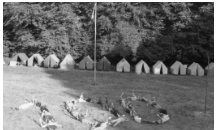
Účastníci letného skautského tábora pri hrách

Skupina našich starších skautov - roverov sa v tento deň zúčastnila celosvetového podujatia s názvom „Úsvit skautingu“, počas ktorého skauti z celého sveta vystúpili na najvyššie vrcholy rôznych pohorí v rôznych kútoch zeme, kde ráno vítali východ slnka a symbolicky i úsvit nového skautského milénia.