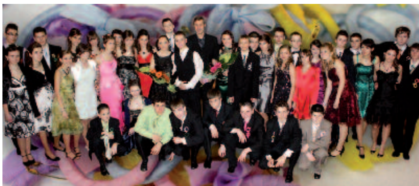
Čo myslíte? Maturanti, alebo ôsmaci? Venček 8. ročníka ZŠ Topoľčianky.