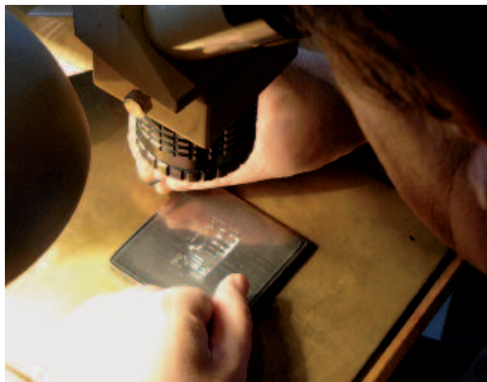
Majster rytec pri práci.

V tento deň Slovenská pošta a POFIS pripravujú viacero možností nášho zviditeľnenia vo svete. Bude vydaná obálka prvého dňa, príležitostná poštová pečiatka a s novou známkou sa takto môžu rozletieť do sveta pozdravy všetkých účastníkov tejto milej slávnosti. Súčasťou slávnosti bude autogramiáda. -ph-