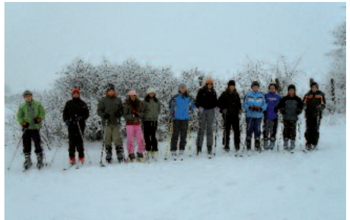
Záber z posledného nástupu lyžiarskeho výcviku žiakov 7.ročníka na zjazdovke „Martonka“, ktorý je najvyšším kopcom v dolnom konci Topoľčianok.