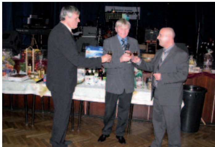
Otvorenie 15. ročníka Záhradkársko – vinohradníckeho posedenia.