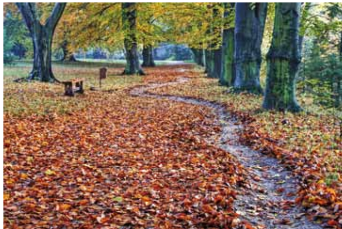
Jeseň v Topolčiankach, ilustračné foto.

Od januára 2008 vychádzajú v plnofarebnej tlači, na kriedovom papieri, vo formáte veľkosti A4, v náklade 1000 kusov. Vďaka priaznivému postojom obecného zastupiteľstva je doručované každé číslo do domácností v Topolčiankach vždy zdarma. Noviny sú v elektronickej podobe uverejnené aj na internetovej stránke obce ( www.topolcianky.sk ) a tak sú dostupné aj pre rodákov žijúcich mimo obce, aj v ďalekej cudzine, ktorí nechcú stratiť kontakt s rodinou obcou.