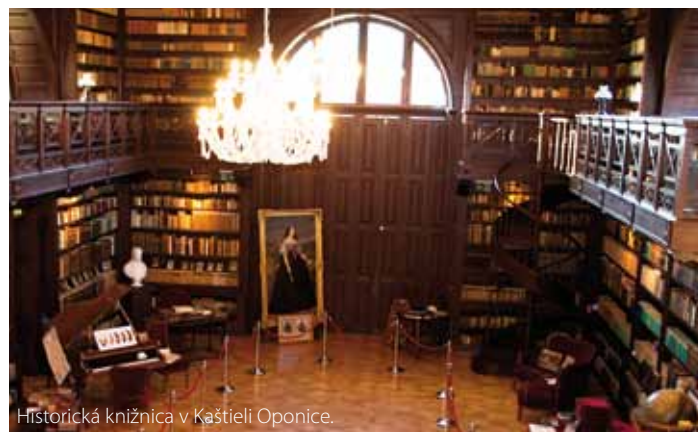
Historická knižnica v Kaštieľi Oponice.