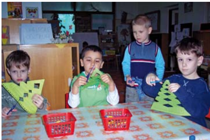
Príprava detí na výstavu,