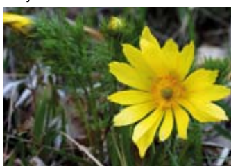
Hlaváčik jarný - chránený druh

Ježiš postupne po svojom zmŕtvychvstaní posilňuje vieru svojich učeníkov. Každé stretnu-