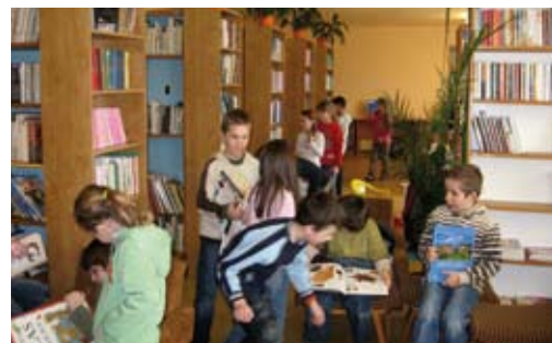
Návšteva detí ZŠ v obecnej knižnici

Za prívlastkom mesiaca „Marec – mesiac knihy“ stojí legendárny širiteľ slovenskej a českej knihy a tým aj osvety a vzdelanosti Martin Hrebenda Hačavský (10. 3. 1796 - 16. 3. 1880). Martin Hrebenda zomrel v marci. Hoci bol slepý, natoľko miloval knihy, že sa mu stali osudom. Putoval po Gemeri, Malohonte až do Viedne, zbieral staré tlače a rukopisy a zachraňoval ich. Medzi slovenských vlastencov a vzdelancov roznášal nové slovenské a české knihy najmä od v y d a v a t e ľ o v