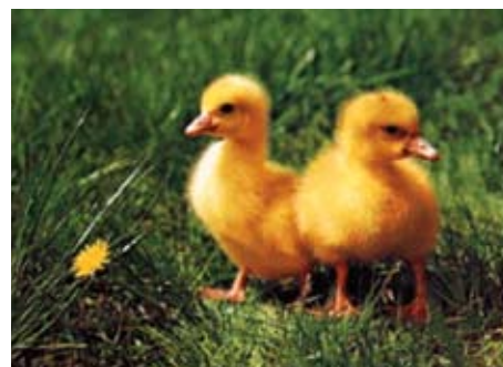
Autor textu a fotografie : T. Bieliková

husi. Starká ich na jeseň vykrmovala kukuricou. Dve z nich sme zjedli na hody a postupne ďalšie. Na plemä nechala starká jedného gunára a dve husi, aby mala na ďalšiu jar väčší krdeľ.