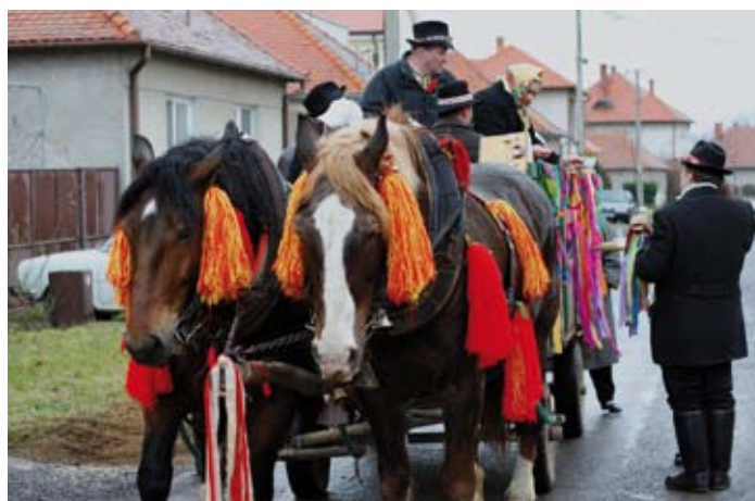
Fašiangový sprievod obcou,