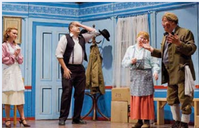
Premiéra divadelnej hry Ferdó šéfom, autor fotografie: Ing. Miloslav Brandt