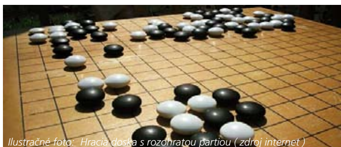
Ilustračné foto: Hracia doska s rozohratou partiou